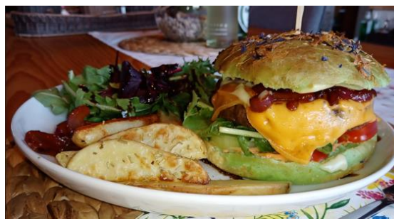
Rezept und Bild: Katharina Stolz

Auf dem Landesjägertag 2024 in Weiden wurde von den Kassenprüfern eine Nachberechnung über den Mitgliedsbeitrag der Erstmitglieder der Kreisgruppen in Höhe von 3,00 € beschlossen. Mit dieser Nachberechnung müssen wir nun pro Mitglied 3,00 € mehr an den BJV abführen. Als Serviceleistung hat der BJV für alle Mitglieder ein Rechtsschutz-Versicherungspaket auf den Weg gebracht, welches jedes Mitglied nutzen kann. Wer dieses Angebot nutzen möchte oder nähere Informationen hierüber wünscht, wendet sich direkt an den BJV.