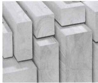
verschiedene Kanthölzer und Dachlatten