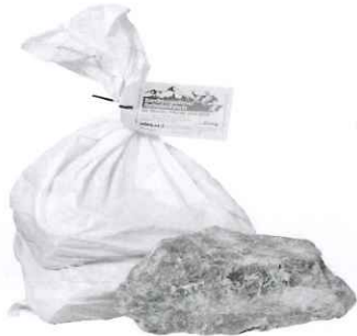
Berchtesgadener Naturleckstein 25kg/Sack

Innovation und Tradition am Bau seit 1902 – Ihr Partner auch für die Jagd