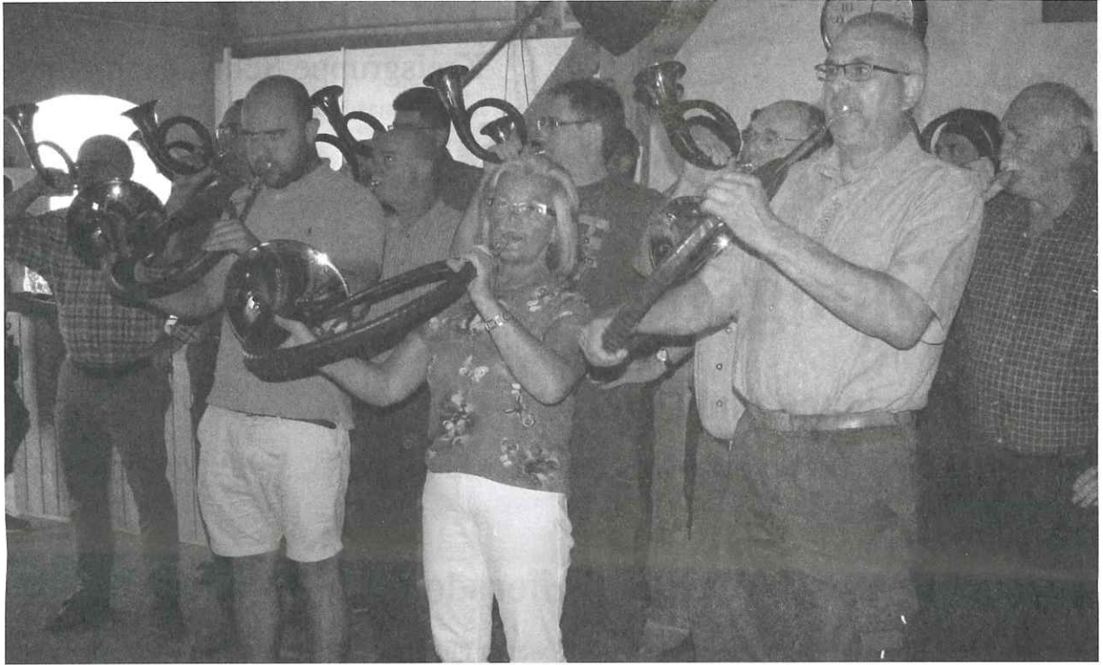
Grillabend mit Übergabe der Ehrenscheibe und Auftritt unserer Jagdhornbläsergruppe